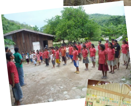
Schüler beim Morgenappell