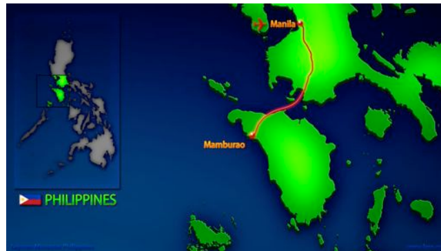
Unser Einsatzort: Mamburao, Occ. Mindoro

Am Ende des Einsatzes bleibt auch noch Zeit, um das schöne Land und seine Artenvielfalt im Meer genießen zu können. Es werden uns eine schöne Landschaft, viele freundliche Menschen sowie feines tropischen Essen erwarten.