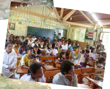
Grundschule der Eingeborenen Dörfern