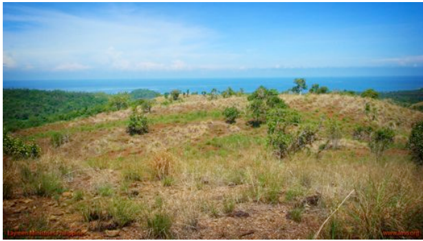
Grundstück für den Bau der High-School