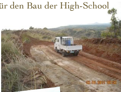
Strasse zum High-School Gelände